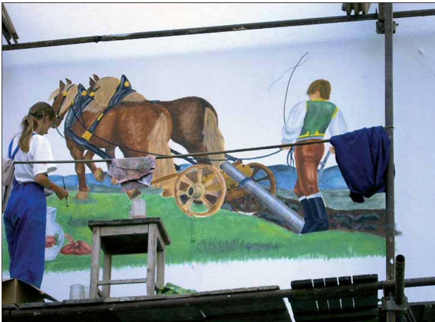
Práce na lešení ve výšce 4 m nebyla vůbec snadná.