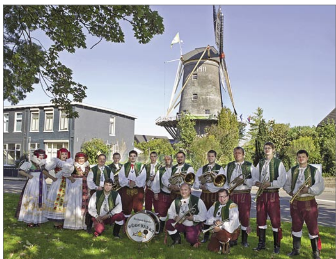
Věrovanka v Holandsku