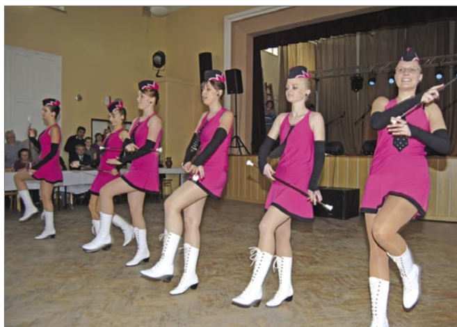
Království hraje, zpívá a tančí